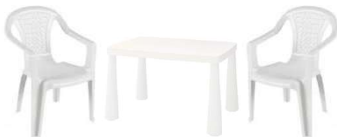
TABLE ET CHAISES